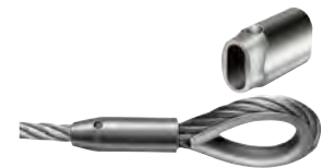
TKonit H (TKH) (aluminium)

f = Fill factor, is the ratio between the sum of the nominal metallic cross-sectional areas of all the wires in the rope and the circumscribed area of the rope based on its nominal diameter.